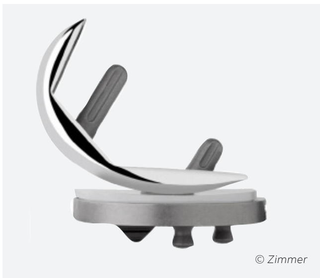
Die Teilprothese besteht aus Gelenkflächen aus Edelstahl sowie einem Zwischenstück aus Kunststoff.

Die Teilprothese (unikondyläre Knieprothese) wird hauptsächlich bei schmerzhafter und fortgeschrittener Abnutzung der inneren Gelenkfläche - der sogenannten Arthrose - eingesetzt. Voraussetzung ist, dass die andern Anteile des Kniegelenkes noch in gutem Zustand sind. Die Operation hat zum Ziel die schmerzfremde Funktion des Kniegelenkes wieder herzustellen.