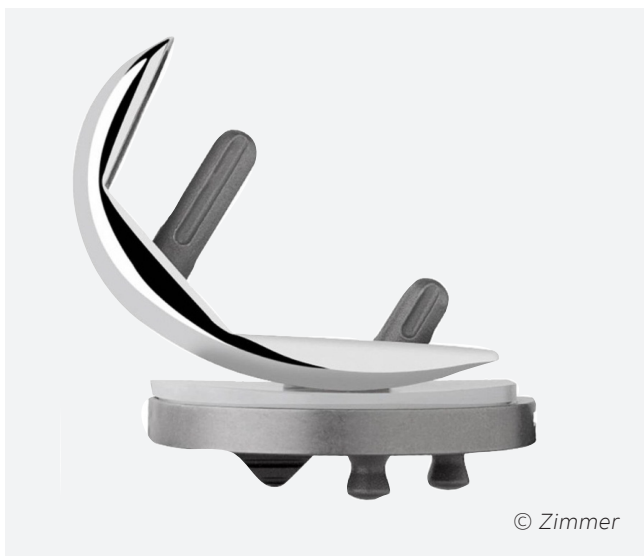
Die Teilprothese besteht aus Gelenkflächen aus Edelstahl sowie einem Zwischenstück aus Kunststoff.

Die Teilprothese (unikondyläre Knieprothese) wird hauptsächlich bei schmerzhafter und fortgeschrittener Abnutzung der inneren Gelenkfläche - der sogenannten Arthrose - eingesetzt. Voraussetzung ist, dass die andern Anteile des Kniegelenkes noch in gutem Zustand sind. Die Operation hat zum Ziel die schmerzfreie Funktion des Kniegelenkes wieder herzustellen.